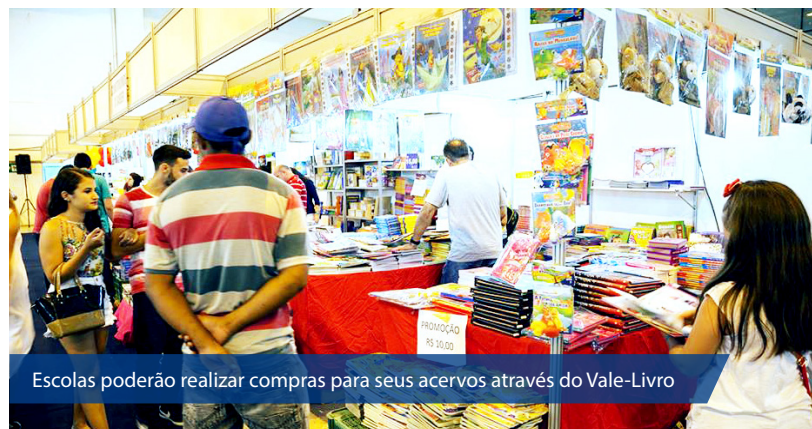
Escolas poderão realizar compras para seus acervos através do Vale-Livro