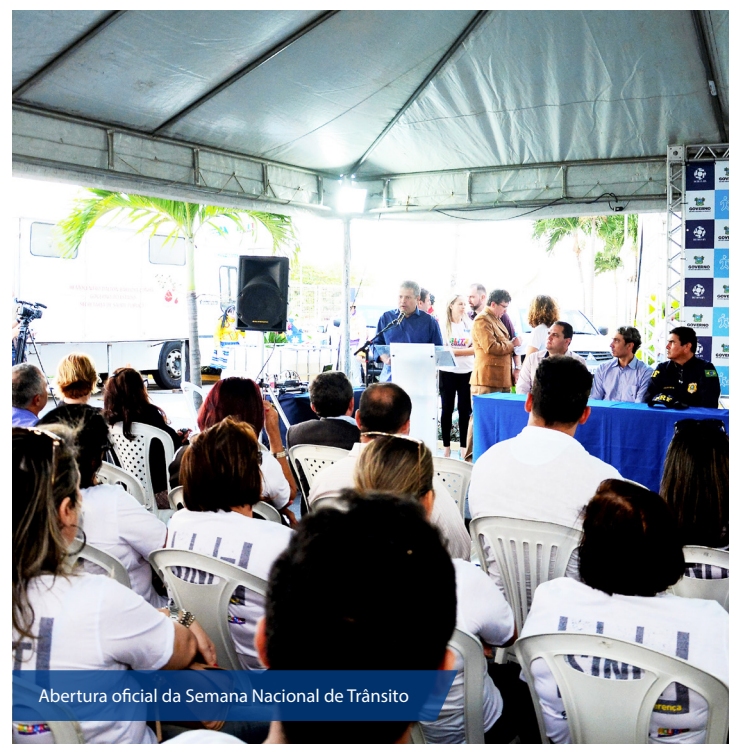
Abertura oficial da Semana Nacional de Trânsito

A SNT é prevista no Código de Trânsito Brasileiro (CTB) e tem a finalidade de conscientizar a sociedade para a criação de um ambiente favorável de valorização da vida, focando o desenvolvimento de valores, posturas e atitudes, no sentido de garantir a segurança e o direito de ir e vir dos cidadãos no trânsito.