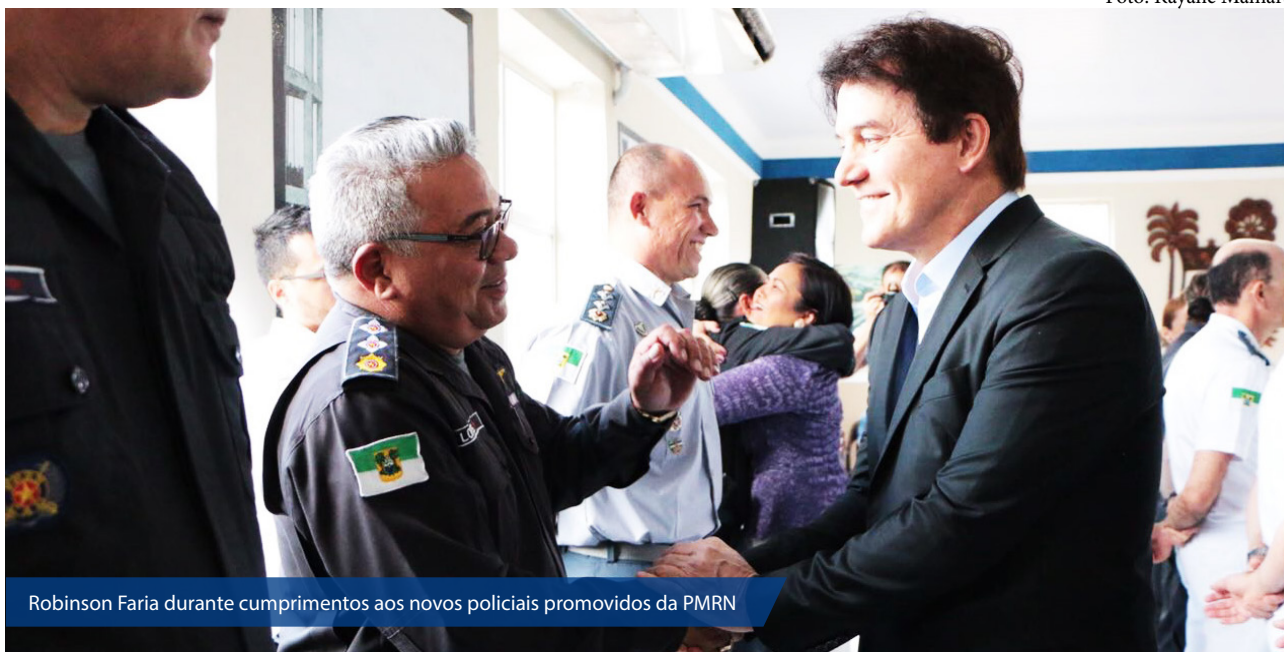
Robinson Faria durante cumprimentos aos novos policiais promovidos da PMRN

O governador do Estado, Robinson Faria, oficializou as promoções de 327 policiais militares do Rio Grande do Norte. Nesta semana ocorreu a cerimônia de cumprimentos aos novos promovidos no Quartel do Comando Geral da Polícia Militar, no Tirol, com a presença da secretária de Estado da Segurança Pública, Sheila Freitas, e do Comandante Geral da PM, Coronel Osmar José Maciel de Oliveira.